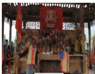
图 3 (小鬼跳)