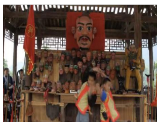
图 6 (小鬼跳圈)