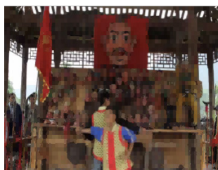
图 4 (小鬼斗拳)