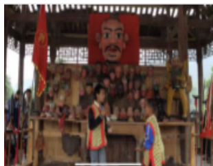
图 2 (小鬼击掌)