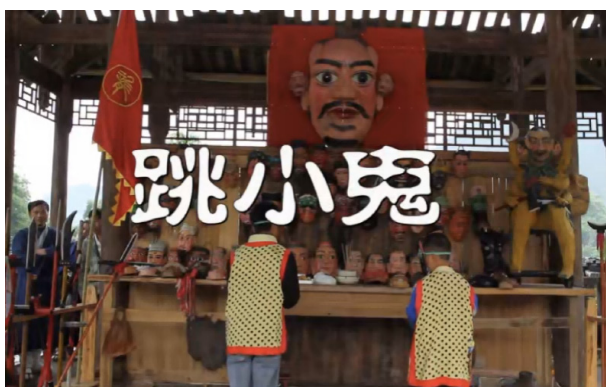
图 1 (开台仪式)