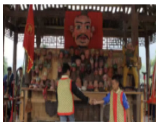
图 5 (小鬼勾指跳)