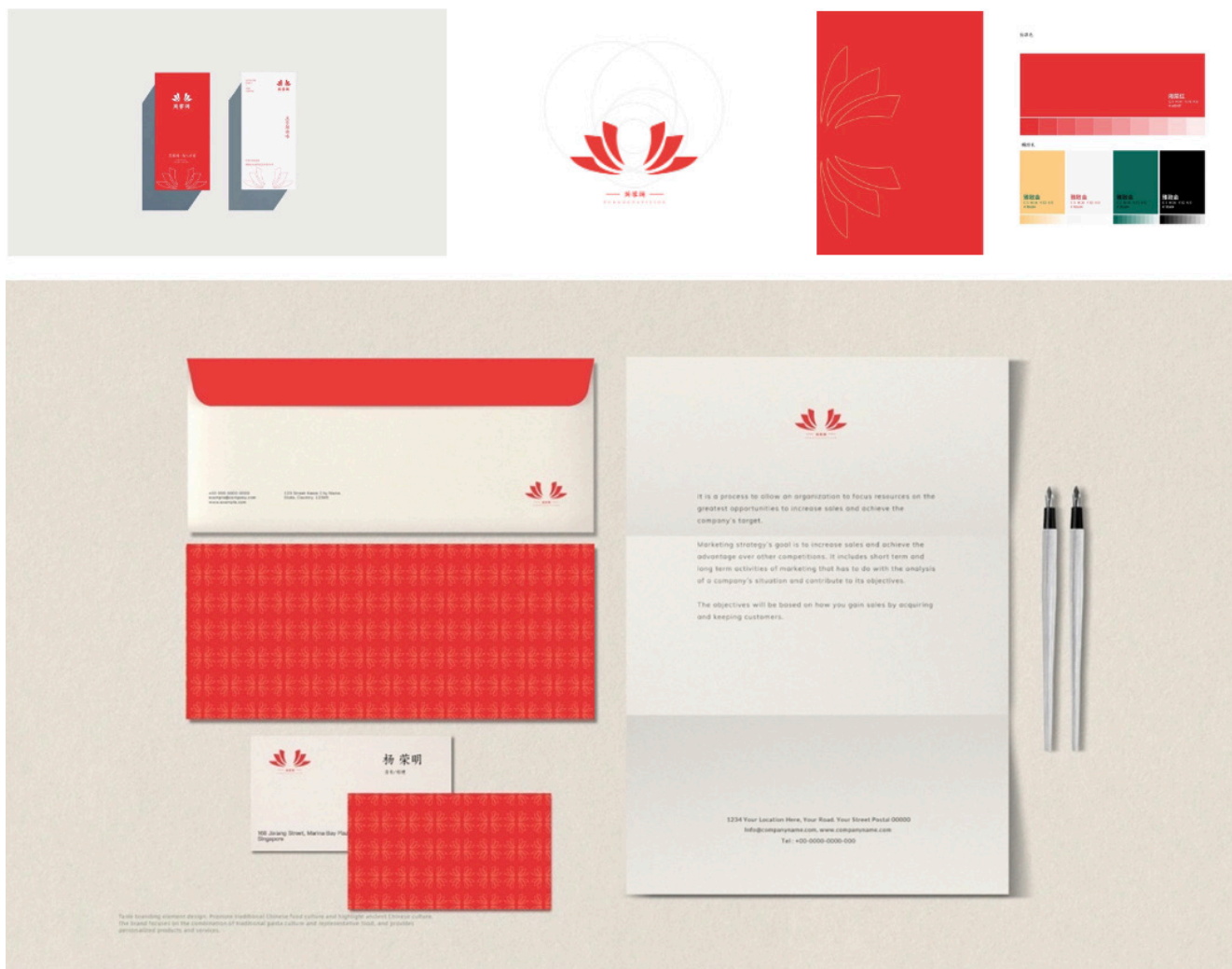
图 3-2 “芙蓉阁”品牌设计

1、设计要素的功能性。品牌标志、VI 系统、包装等设计要素需要具备一定的功能性，能够满足餐饮行业的特点和需求。品牌的命名要简单好记但又不失个性和特色，要有理可依，有据可循，最好贴近产品属性，有利于品牌的传播（段，2020）”。人们在就餐时会进行例如，品牌标志需要简洁易记、易识别，能够在不同媒介和场景下表现清晰；VI 系统需要具有规范性和可操作性，能够方便地应用到不同的设计材料中；包装设计需要具有保护、包装、宣传等多重功能，同时还需要符合餐饮行业的卫生、安全等要求。