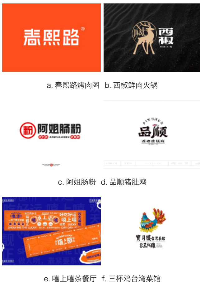
图 2-1 各类餐饮品牌形象调研比较图

就是人们日常所说的 VI 设计，是企业识别系统（CI）中的一部分。CI 是由 3 个子系统组成，分别是理念识别 MI（Mind Identity）、行为识别 BI（Beha VIOUrldentity）和视觉识别 VI（Vision Identity）。CI 设计最早源自于 50 年代的美国，于 60-70 年代逐渐在日本流行起来，日本理论家“中西元南”发表了《经营策略的设计系统》著作，第一次较为完整的提出了 CI 概念，自此奠定了企业形象识别系统的理论框架。戴维·阿克（David A Aaker）提出“品牌形象是品牌战略制定者渴望创造并保持的一系列独特的联想（Keller，2001）”。