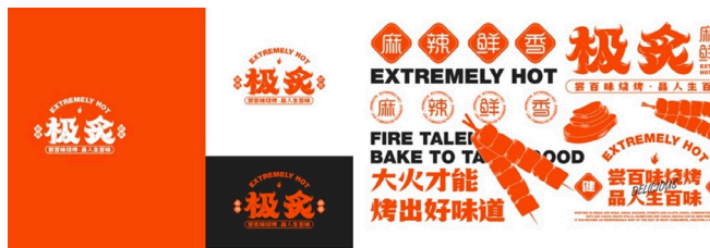
图 2-8 极炙烧烤店品牌颜色与图形