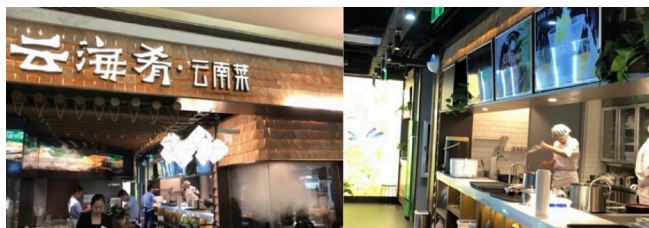
图 2-7 云海肴品牌门面定位