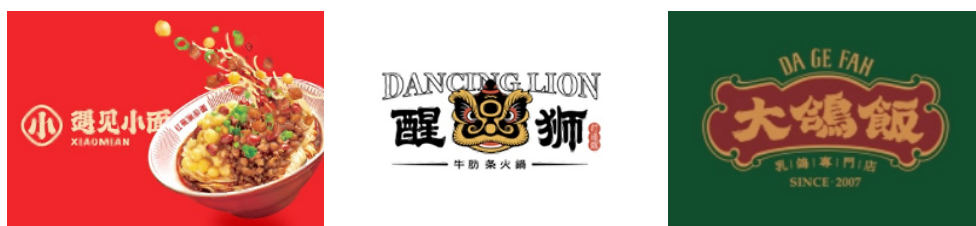
a. 遇见小面品牌 logo b. 醒狮火锅品牌 logo c. 大鸽饭品牌 logo