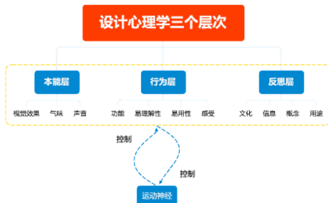
图 1-1 图设计心理学三层次 (图片来源: 笔者自绘)