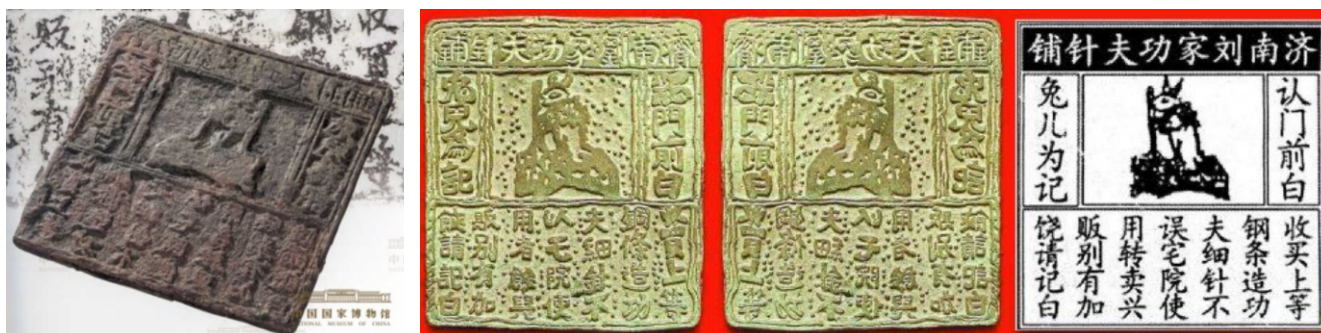
a. 刘家功夫针铺品牌标识原版图 b. 刘家功夫针铺汉化解析图

反思层次是一种高级的情感化设计方法,其目的是通过人们对产品、符号、环境所产生的情感体验来实现他们的感知、思考和自我价值。这种设计方法包含许多领域,并且会受到文化差异、生活环境、经验、流行时尚等因素的影响。在反思层次的设计中,个