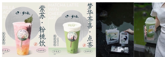
图 2-6 “喜茶”联名只此青绿门包装

品和菜系很多，但是点都德餐厅在整体品牌设计上，融入了粤菜中广州人喜欢喝早茶的元素。在一个四方形桌中通过茶来融入当地文化的习俗，再加上使用本土化元素粤语“点