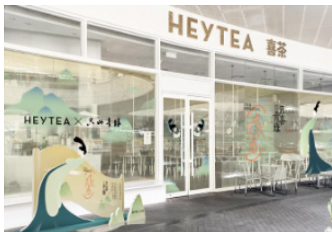
图 2-5 “喜茶”联名只此青绿门店装修

我国餐饮品牌种类众多、川菜、湘菜、粤菜、闽菜、苏菜、浙菜、徽菜和鲁菜、每种菜系中的口味也各有不同。在市面中简单的品牌形象设计让用户难以区分，难以找到自己钟爱口味的餐饮品牌。品牌可以根据自身菜系的特色和文化凸显其品牌特征，提炼菜系中给人的关键元素和感受，从而可以更精准地区分自身餐饮种类。例如：粤菜中的“点都德”茶餐厅，虽然在市面上同类竞争的餐