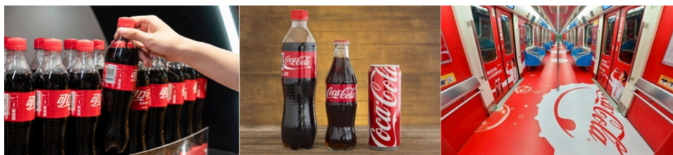
图 2-9 可口可乐品牌标准化案例 (图片来源: www.baidu.com)