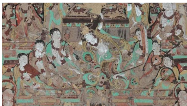
图1：《观无量寿经变之反弹琵琶乐舞》

《观无量寿经变之反弹琵琶乐舞》来源于莫高窟第112窟南壁（图1），图中有6名乐伎和1名舞伎，舞伎居于中央，呈现反弹琵琶的姿态，乐伎则对称分列于两侧。左侧乐伎所奏乐器包括拍板、横笛、鼗鼓与鸡娄鼓（由1人兼奏）；右侧乐伎演奏琵琶、阮与竖箜篌。其中的舞伎将琵琶用右手腕靠压在脑后肩部位置，琵琶的龟背面向靠近头部，面板向后以便用右手弹拨。左手持琵琶颈部按着琴弦。画中将按弦的瞬间描绘的极为细致，五根手指高低错位按着琵琶弦。舞奏者弹拨琵琶的同时惜腿拧身，欲要完成与所弹旋律相合的动作（马、张，2023）。舞伎高髻云鬓的发式、丰腴的面部、温婉柔和的神情，是典型的唐代美人（天人）的特点。敷彩以石绿、赭黄、铅白为主，使整个画面显得典雅、柔和。舞伎以其独特的反弹琵琶姿势和宁静专注的神态，传达了一种超越现实束缚的自由精神。这种姿势不仅展示了高超的技艺，也体现了一种超越现实的艺术想象（高，2021）。