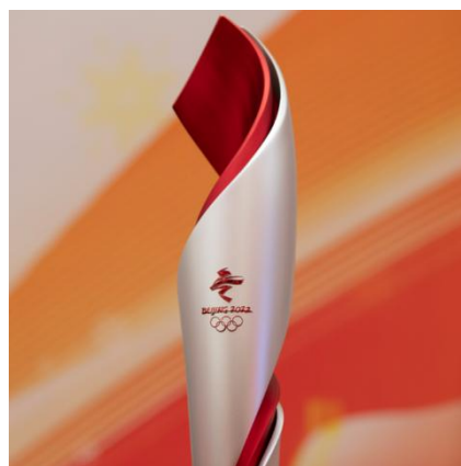
图 4：“飞扬”火炬的设计