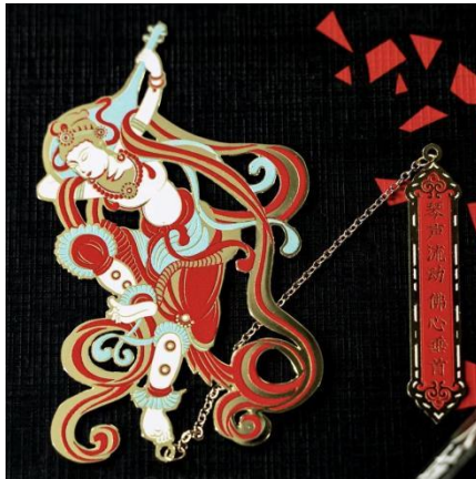
图2：《文创产品设计-琵琶书签》