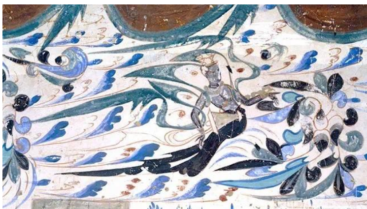
图 3：敦煌莫高窟 285 窟“中原式飞天”

莫高窟 285 窟的“中原式飞天”（图 3）。图中敦煌飞天在云气飘渺、天花旋转的背景中，他袒上身、着长裙，飘着丝带，朝洞窟正壁方向飞翔，持着鼓，面带微笑，飞天动作潇洒，神态风雅。“飞扬”火炬设计（图 4）将敦煌飞天中的丝带与“飞扬”的“丝带”相叠，盘旋而上，像红旗漫卷飞舞。“飞扬”火炬整体结构主要由两部分构成：银白色外飘带与红色内飘带，双层螺旋设计向上延展，形成别具一格的立体造型。“飞扬”火炬选用碳纤维陶瓷材料，将中间部分掏空，呈现出“瓷火之美”的审美意蕴，陶瓷材料凸显了中国特色，属于“实”的部分，中间螺旋上升的负空间属于“虚”的部分，整体上虚实相生。这种独特的外观设计不仅赋予火炬美感，还创新了火焰燃烧的表现形式，使火焰能够沿着内外飘带的缝隙盘旋升腾，进一步彰显其设计的独创性与视觉冲击力。此部分符合潘诺夫斯基理论中“前图像志”层面对形状、色彩、材质和造型的直观描绘与视觉感知的要求。