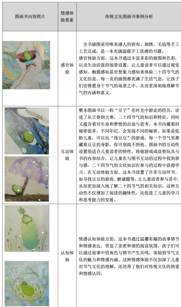
表格 3-6 《豆豆游走的二十四节气》情感体验分析