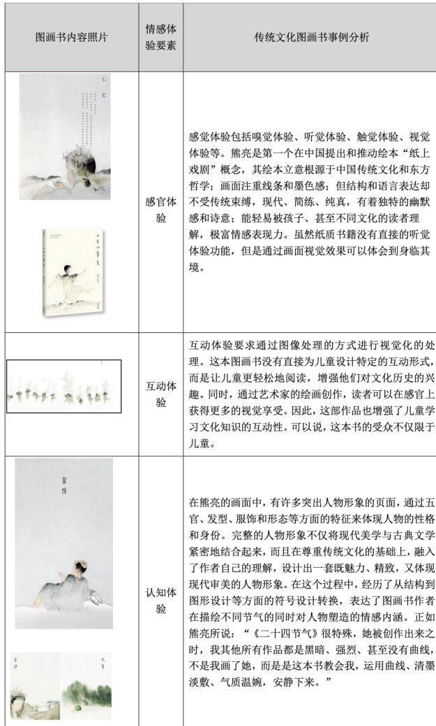
表格 3-8 《二十四节气》情感体验分析

计者关注儿童的情感需求和儿童阅读时的情感体验。重视儿童情感，将对儿童的身心健康发展产生积极影响，对儿童情感发展奠定良好基础。学龄前儿童要及早掌握基本的知识、算术和社会情感技能，为成功接受初等教育做好准备。在未来的研究中，研究人员应更深入地利用儿童的情感需求，有助于提高学龄前儿童的教学质量，并提供更有效的沉浸式学习效果，从而提高学龄前儿童的图画书阅读价值。