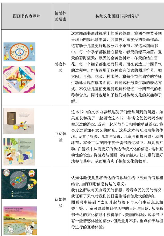
表格 3-4 《二十四节气只能科学的 12 个理由》情感体验分析

的故事设置和情感输出都包括传统节日、习俗、传统饮食、传统理解等知识。图画书中都有情感体验的要素，符合 2022 年联合国教科文组织会议关于提高儿童教育质量对提高儿童教育社会情感技能的质量要求。第二，在提高情绪体验的丰富性方面，画册通过画册的