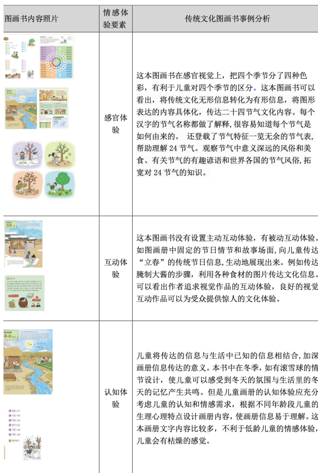
表格 3-3 《一览无余的二十四节气图画书》情感体验分析