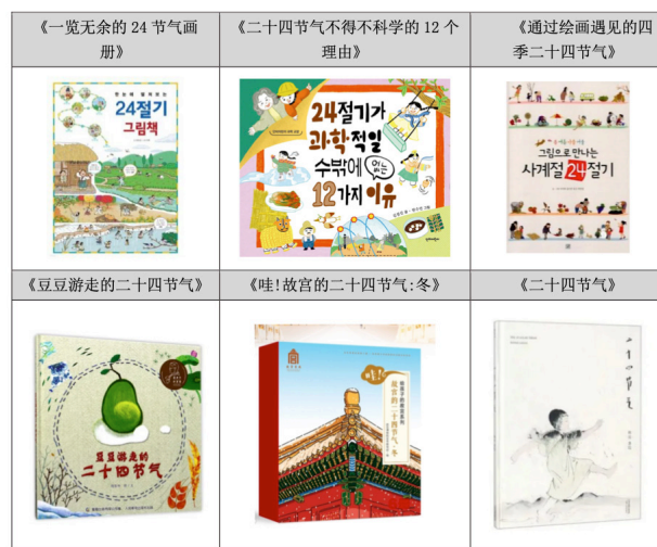
表格 3-2 研究样本图画书介绍

了更加充实地理解正文的附录,增加了趣味性和有益性。希望通过阅读过程中以温暖朴素的感性填满心灵的《通过画相遇的四