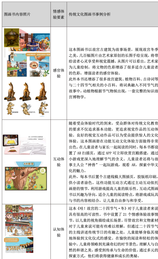
表格 3-7 《哇！故宫的二十四节气·冬》情感体验分析

儿童画册是启蒙儿童教育的重要方法，由图画和简单的文字组成。多年来，由于用作儿童学习媒介的各种电子产品不适合儿童的视力，纸质画册一直作为主要媒介存在。在此背景下，本文从情感体验的角度看待儿童画册，结合情感设计相关理论和实际案例分