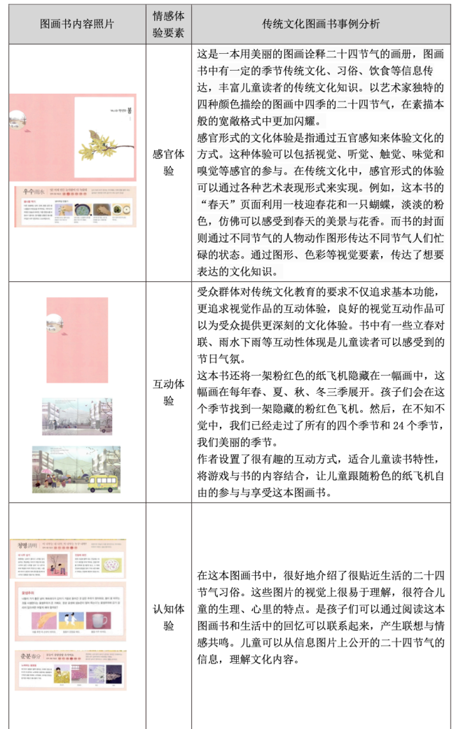
表格 3-5 《通过绘画遇见的四季二十四节气》情感体验分析

会模仿画册理解的内容。儿童从图画书中学到的知识会渗透到成长过程中遇到的社会问题，对思考和行动也会产生影响。案例可以看出在知识类传统文化图画书中，文化内容很丰富，对于儿童来说传播文化知识比较枯燥，还是缺失很多互动设计元素，还需要艺术家和设计师多从儿童的情感体验角度出发。通过图画书的感觉体验、互动体验、认知体验等，对提高儿童的感情体验非常有效，可以做到有趣的文化知识输出。为了让儿童体验到更多的互动体验，未来儿童画册设计可能包含