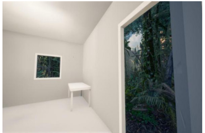
图5 《Edge of the Present (当下的边缘)》

定位, 寻找到一个可以安静自我的舒适味道, 从而恢复体力、调整心态, 勇敢地重新出发。