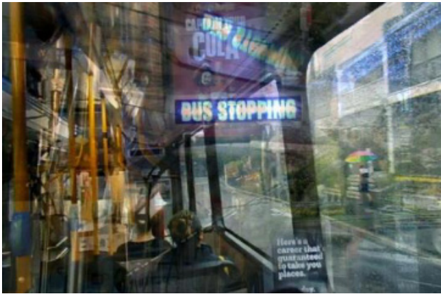
图4 《Sydney Smell Map (悉尼嗅觉地图)》

枢，突破参与和艺术接触的界限，同时深入了解神经多样性。《Snoosphere (智慧圈)》根据不同的感官强度进行了精细校准，使参与者能够通过自己的运动、触摸和存在来调整和适应环境的感官输出。当参与者漫步穿过由反应光纤组成的被风吹过的草地、触发机器人高音扬声器的森林，或者在轻轻接触皮肤的雾化雾云下方时，地板会对重量和脚步做出动态响应。整个装置呈一个包围球体，给参与者予以一种安全且舒适的空间感，这样的环境使参与者更加致力于对自我神经多样性的探索，以减轻感官焦虑与内在压力。