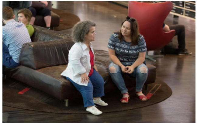
图1 《Awkward Conversation (尴尬对话)》