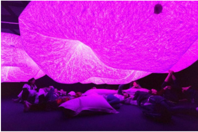
图3 《Snoosphere (智慧圈)》