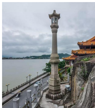
图 3： 北阁佛灯

烈的共鸣。如图 3 所示。石佛灯塔，是潮州八景之一的北阁佛灯。于 1985 年经历重建，其高度为 7 米，仿照唐代石经幢的形态设计。灯身呈现出六边形的结构，四周雕刻着佛像和云纹图案，展现出深厚的艺术韵味。灯座则巧妙地塑造成观音菩萨坐在莲花之上的形象，寓意着慈悲与清静。根据民间传说，某日夜深人静，京城皇帝陷入沉睡，梦中惊见佛灯熠熠生辉，照耀龙床之侧，梦醒之后，皇帝深信此灯源自潮州北阁之灯。自此以后，北阁佛灯的地位直线上升，备受尊崇，从航标之灯晋升为神明之灯，最终更被尊为佛灯。顺应时代变迁，佛灯已由昔日油灯演变为现代电灯。在不同文化背景下，人们的审美观念存在差异。因此，景观材料的选择必须与当地的民间传说文化相契合，才能营造出独特且富有特色的景观环境。对于一些具有独特意义和内涵的文化元素，可以将其直接提取，运用于景观照明设计中。例如，在北阁佛灯的照明设计中，其最具特色的文化是民间传说，在照明中可以结合民间传说文化对其进行具象化，做好元素提取和整合，设计出能展现当地民间传说文化特色的照明外观。材质的选择上，要考虑不同材质所给予人的视觉感受和心理联想。结合民间传说的文脉气质，强化其表现力。运用现代科技手段，打造既美观又实用的民间传说文化遗产景观照明，以彰显其文化底蕴。