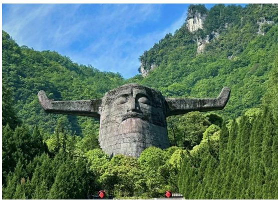
图 2： 神农雕像

其身份与地位的象征。对于神农像的面部刻画，更是独具匠心。他双目微闭，仿佛沉浸在深深的沉思之中，给人以昏昏欲睡之感。然而，这恰恰体现了道家所倡导的“道法自然”之理念，以及“垂帘内视”的修行之道。在道家看来，这种闭目内视的状态，是一种心灵的静定，是对于自然与宇宙的深刻体悟。通过此，人们得以洞察万物的本原，从而达到心灵的自由与超脱。神农氏的这一形象，正是对于道家修行理念与智慧的完美诠释。运用“意境”激发观众联想的能力，是一种独特的设计技巧，要求设计师在文化内涵方面拥有深刻的洞见，并且在塑造形象的细微之处追求完美。通过这种深厚的文化理解与精妙的造型细节，作品将更具吸引力与深度。提取神农传说的核心元素，总结其主要特点，随后将这些特点转化为符合现代认知模式的视觉元素。通过运用特定的造型手法，成功将民间传说转化为现代视觉表达方式，进而实现其在景观设计中的传承。这种表达方式既符合现代社会的审美需求，又使民间传说得以更为直观、生动地延续下去。