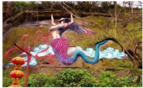
图4： 女娲补天浮雕