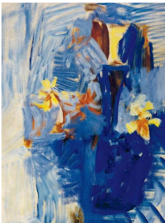
图4：吴大羽《色草》绘画作品 1984年

红、黑、黄等色则点缀、穿插其间，以变化丰富的色彩构造出空间；从肌理塑造来看，颜料被反复叠加，正是吴大羽对质感的不懈追求，拓展了中国画的审美趣味，创造了新的意境；从形态结构来看，画面以多排笔触横扫，或一笔勾勒，力量感并未消失，而是更为凸显，线条犹如在画布上游走。“势象”理论的借用使得吴大羽的抽象绘画气度不凡、充满生命力。正如我国艺术理论家邵大箴对吴大羽的抽象绘画称赞为“创造出独树一帜的富有个性和现代感的油画艺术”（邵，2004）